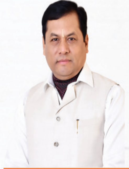
সৰ্বানন্দ সোণোৱাল মুখ্যমন্ত্ৰী, অসম

ক'ভিড-১৯ মহামাৰী প্ৰতিৰোধৰ বাবে ৰাজ্যখনত অব্যাহত থকা সংগ্ৰামত উল্লেখনীয় ভূমিকা লৈ ৰাইজৰ সকাহৰ অৰ্থে অবিৰতভাৱে সেৱাত নিয়োজিত প্ৰতিগৰাকী কৃষক তথা কৃষি বিভাগ খাদ্য, অসামৰিক যোগান আৰু গ্ৰাহক পৰিক্ৰমা বিভাগ উপায়ুক্ত, মহকুমাধিপতি, চক্ৰ বিষয়া, খণ্ড উন্নয়ন বিষয়াৰ কাৰ্যালয় জনস্বাস্থ্য কাৰিকৰী বিভাগ আৰু জলসম্পদ বিভাগৰ বিষয়া-কৰ্মচাৰী তথা অসমৰ সকলো চাফাই কৰ্মীলৈ আন্তৰিক কৃতজ্ঞতা জ্ঞাপন কৰিছোঁ।