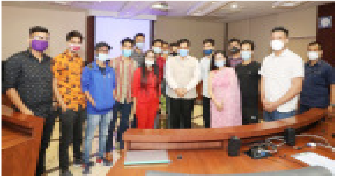
অসমৰ যুৱ প্ৰজন্মৰ জনপ্ৰিয় ইউটিউবাৰ আৰু ভিডিঅ' ব্লগাৰৰ প্ৰতিনিধিৰ সৈতে মুখ্যমন্ত্ৰী