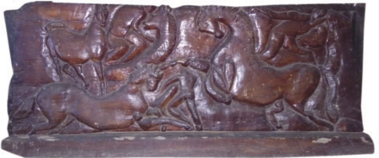
3 - Horses and Men, Wood, 90X20X15 cms