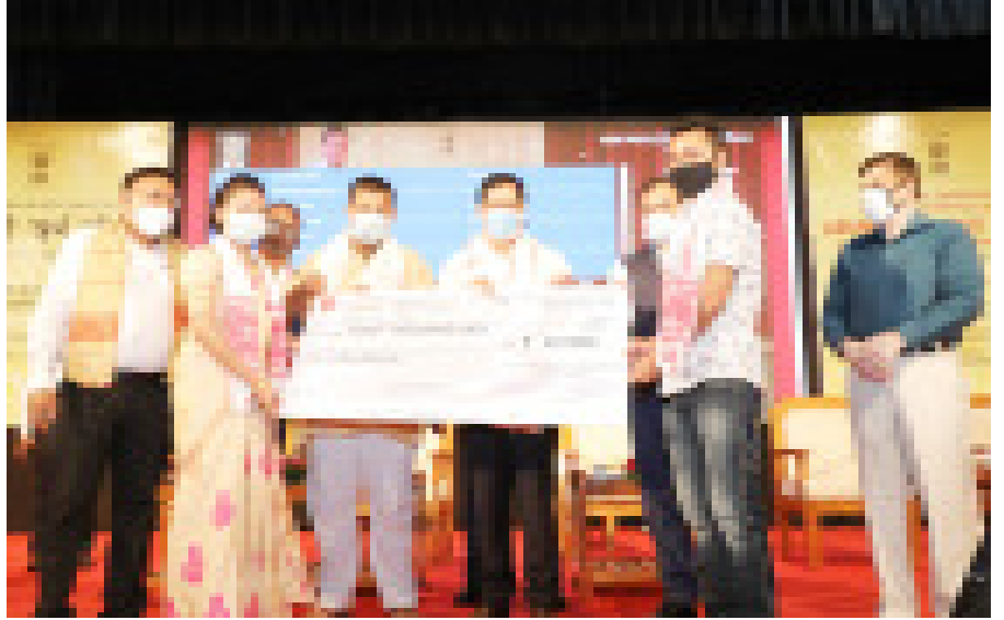
অৰুন্ধতী স্বৰ্ণ আঁচনিৰ হিতাধিকাৰীক চেক প্ৰদানৰ মুহূৰ্তত মুখ্যমন্ত্ৰী, বিত্তমন্ত্ৰী, ৰাজহমন্ত্ৰী, মুখ্যমন্ত্ৰীৰ মিডিয়া উপদেষ্টা আৰু বিশিষ্ট ব্যক্তিসকল