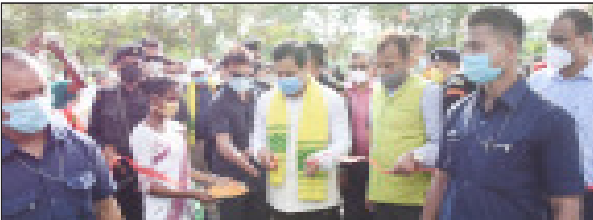
ধুবুৰী জিলাৰ চাপৰ চাহ বাগিচাত বীৰচা মুণ্ডা ষ্টেডিয়ামৰ শুভ উদ্বোধনৰ মুহূৰ্তত মুখ্যমন্ত্ৰী