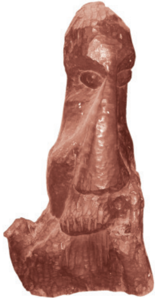
2 - Wood Curving