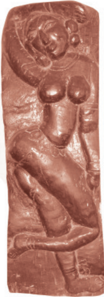
1 - Wood Curving

প্রয়াত ভাস্কর্য শিল্পী হেলা দাসৰ কেইটিমান ভাস্কৰ্যৰ আলোকচিত্ৰ