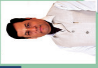
সৰ্বানন্দ সোণোৱাল মুখ্যমন্ত্রী, অসম

ঘোষণা কৰিছে আৰু তেওঁলোকৰ পৰা আবেদন আহুন কৰিছে।