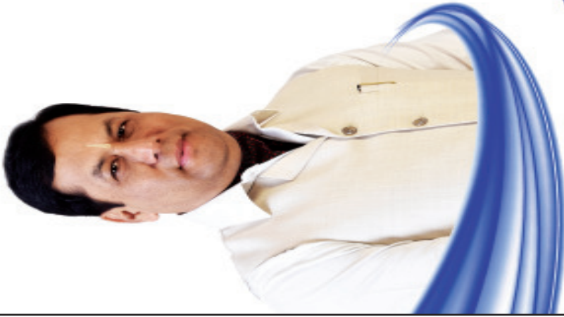
সৰ্বানন্দ সোণোৱাল মুখ্যমন্ত্রী, অসম