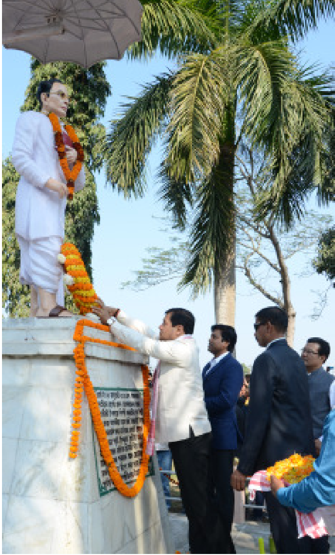
শিল্পী দিৱসত ৰূপকোঁৱৰবলৈ শ্ৰদ্ধাঞ্জলি, ভোলাগুৰি চাহ বাগিচাত