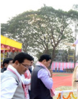
চিলাৰায় দিৱসত বীৰ চিলাৰায়