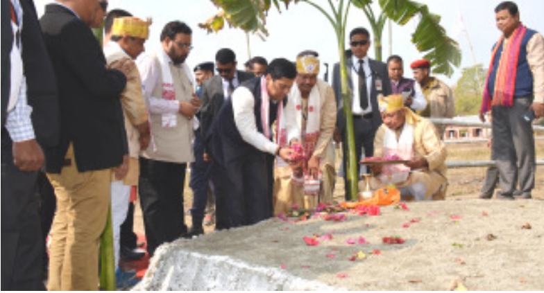
মে-ডাম-মে-ফীত মুখ্য মন্ত্ৰী, ধেমাজিত