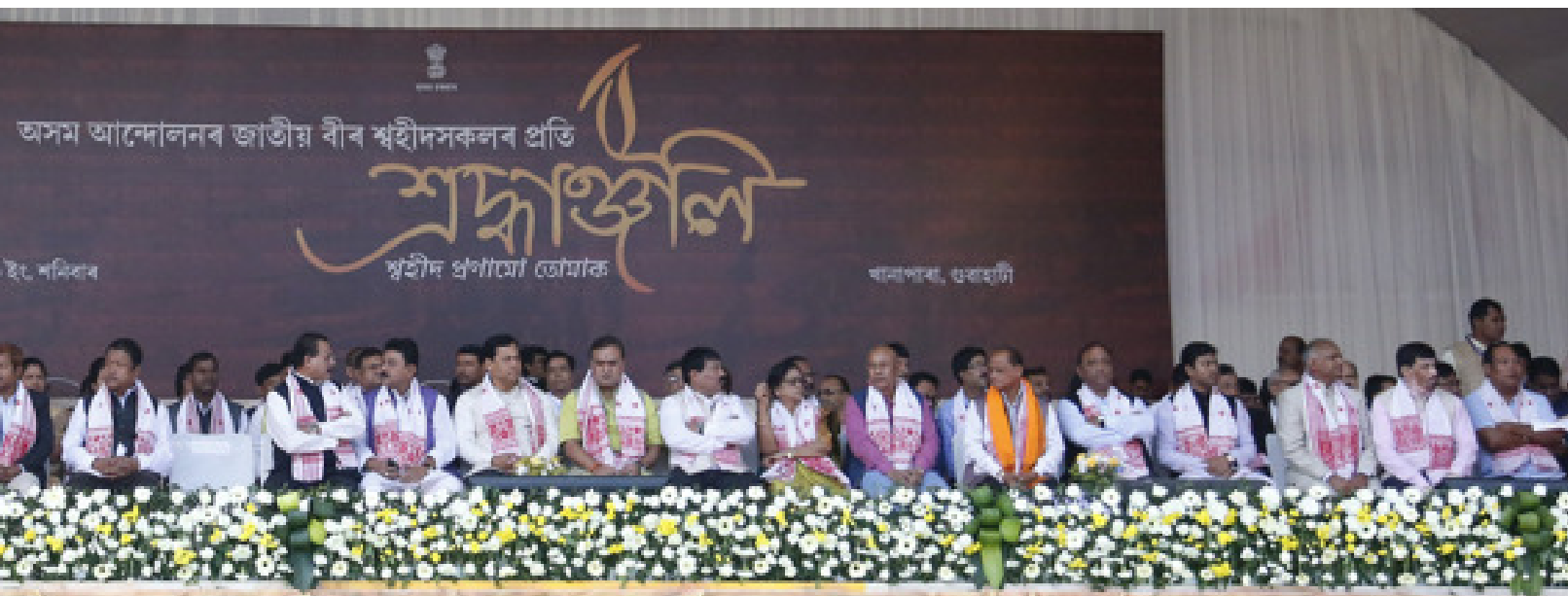
শ্ৰদ্ধাঞ্জলি অনুষ্ঠানত ছহিদ পৰিয়ালৰ একাংশ, মুখ্য মন্ত্ৰী সোণোৱাল আৰু সতীৰ্থবৰ্গৰ ছহিদলৈ শ্ৰদ্ধাঞ্জলি