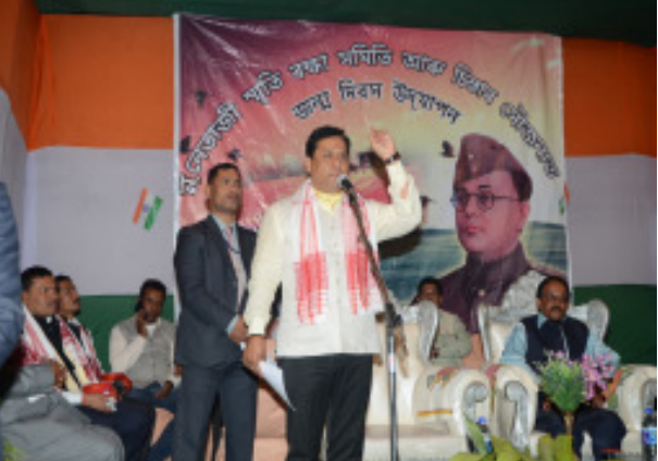
নেতাজীৰ জন্ম দিৱসৰ অনুষ্ঠান, ডিব্ৰুগড়ত