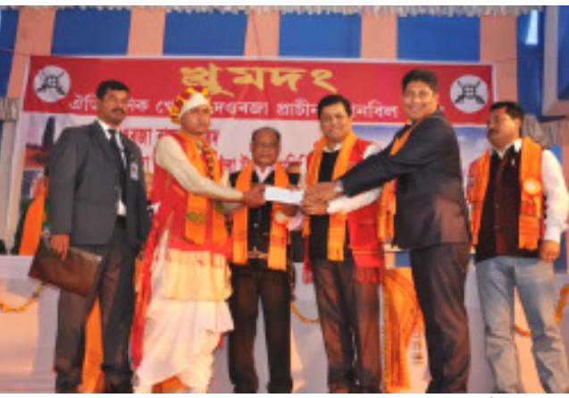
গোভা ৰজাক মুখ্য মন্ত্ৰীয়ে চেক প্ৰদানৰ মুহূৰ্ত